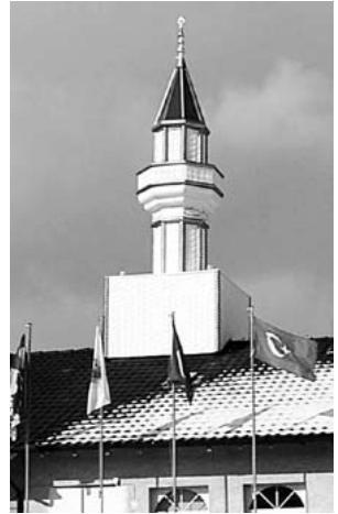
这是瑞士著名的呼拜楼，它在2009年激发了一项全民复决案。

召唤的声音大多由与清真寺相连的呼拜楼所装设的扩音器播放出来。有时使用预先录制的人声，但大多数人喜欢听真人的召唤声。有些呼拜者因召唤的声音庄重、专业化，拥有美声和音乐般的素质而大大出名。最近Sebastian Brameshuber 制作了一部名叫《呼拜者》的记录片，拍摄了呼拜者的表情及在土耳其所举行的呼拜者比赛实况 ( www.muezzindocumentary.com )。影片中有一位呼拜者说：「有愈多人能被我的声音吸引来到清真寺，我就愈成功。」