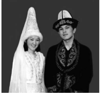
图中这对男女出现在广告宣传中，鼓励人要双方同意才结婚。

吉尔吉斯斯坦有40%的新娘，基本上是在被绑架和胁迫下成婚的。这种世代流传下来的部落风俗，对许多人来说是一项「传统」，实际上它违背了十诫中的「不可偷窃」这一诫。苏联统治期间，这种做法受到禁止，但没有完全消除，而近数十年来又大幅出现。值得高兴的是，仍有小部分婚姻是经过媒合、协商和双方同意而成亲的。抢新娘是犯法的，但多数违法者都未被起诉。伊斯兰也反对强迫式的婚姻。