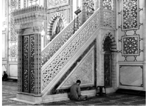
在许多大清真寺里，传道人是站在这高台上讲道的，他们在这高台上可以看到全部的人。图中这精美的讲台位于叙利亚大马士革的一间清真寺内。

每周五一过正午，全球各地可能有数亿的穆斯林走向清真寺。某些地方几乎所有男性都到清真寺去聆听宗教领袖的讲道，讲道者通常是带领众人拜祷的伊玛目，但不尽都如此。目前的讲道内容可以有多种论题。典型的讲道论及日常生活里道德及属灵方面的事，根据古兰经，以穆罕默德的传统教导及伊斯兰历史上的典范作为指引。有些国家里，穆斯林传道者藉讲道告诉大家如何防止电视及网路占据儿童的生活；有时论及国际事件、巴勒斯坦人及其他。政府通常会给宗教领袖们一些引导，以免有人利用讲台做激进言论。